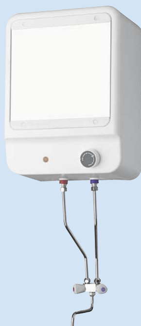
EO 944 P