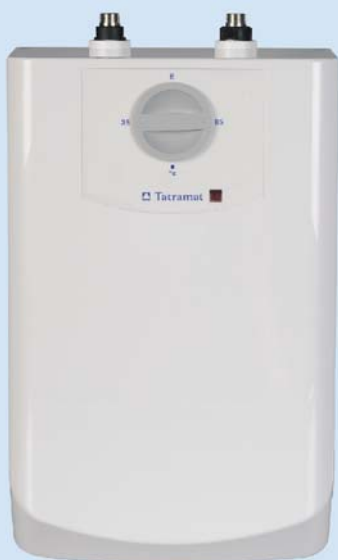
EO 5 P NOVÉ